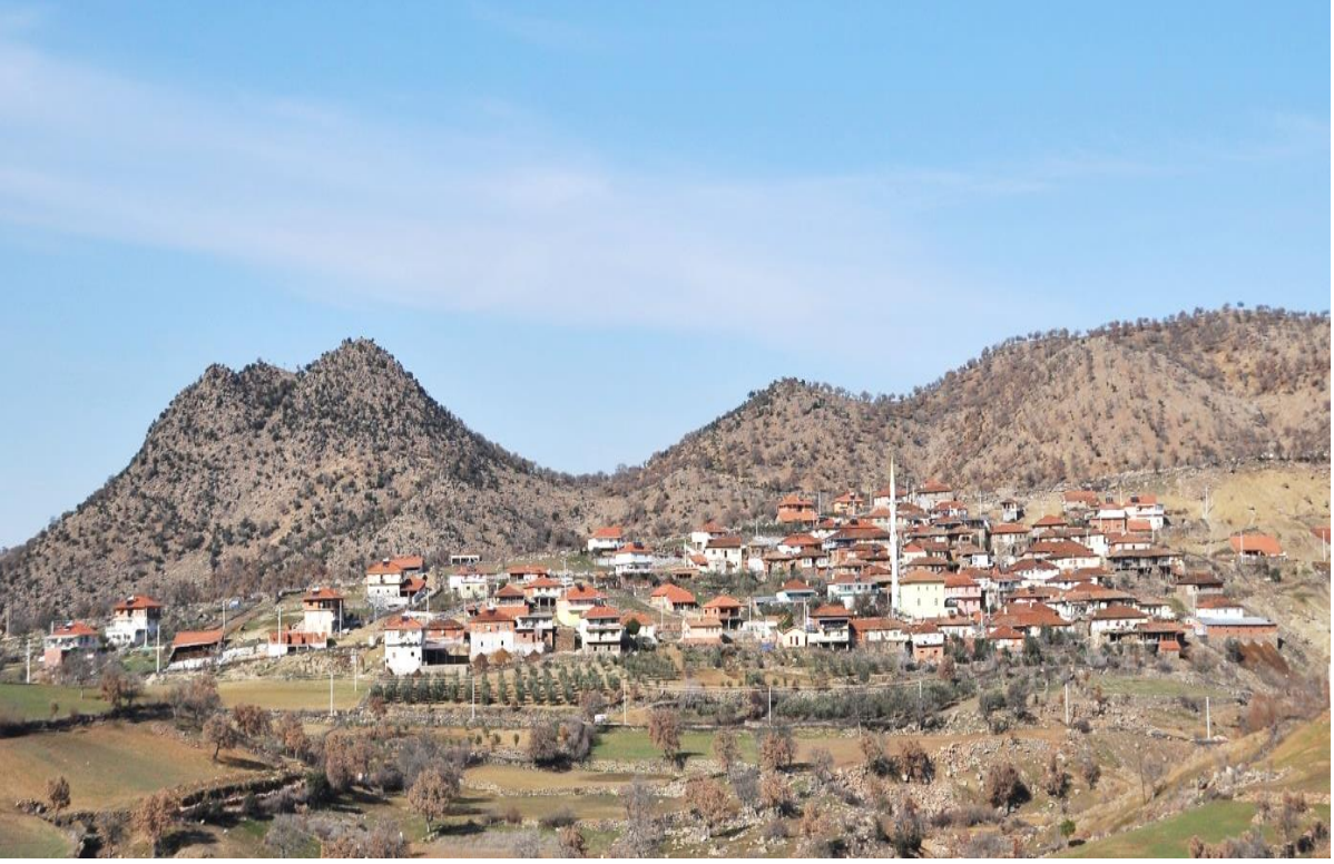
Fotoğraf No 1 Őehir Nahiyesi K ylerinden Sayık K y n n G n m zdeki G r nt s .