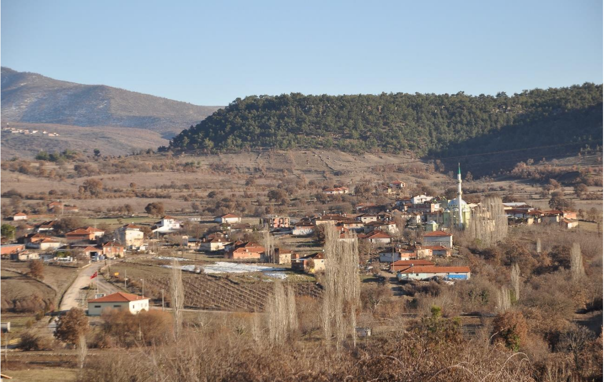
Fotoğraf No 2 Kaza  iftliklerinden Alağaç  iftliđinin (K y n n) G n m zdeki G r nt s .